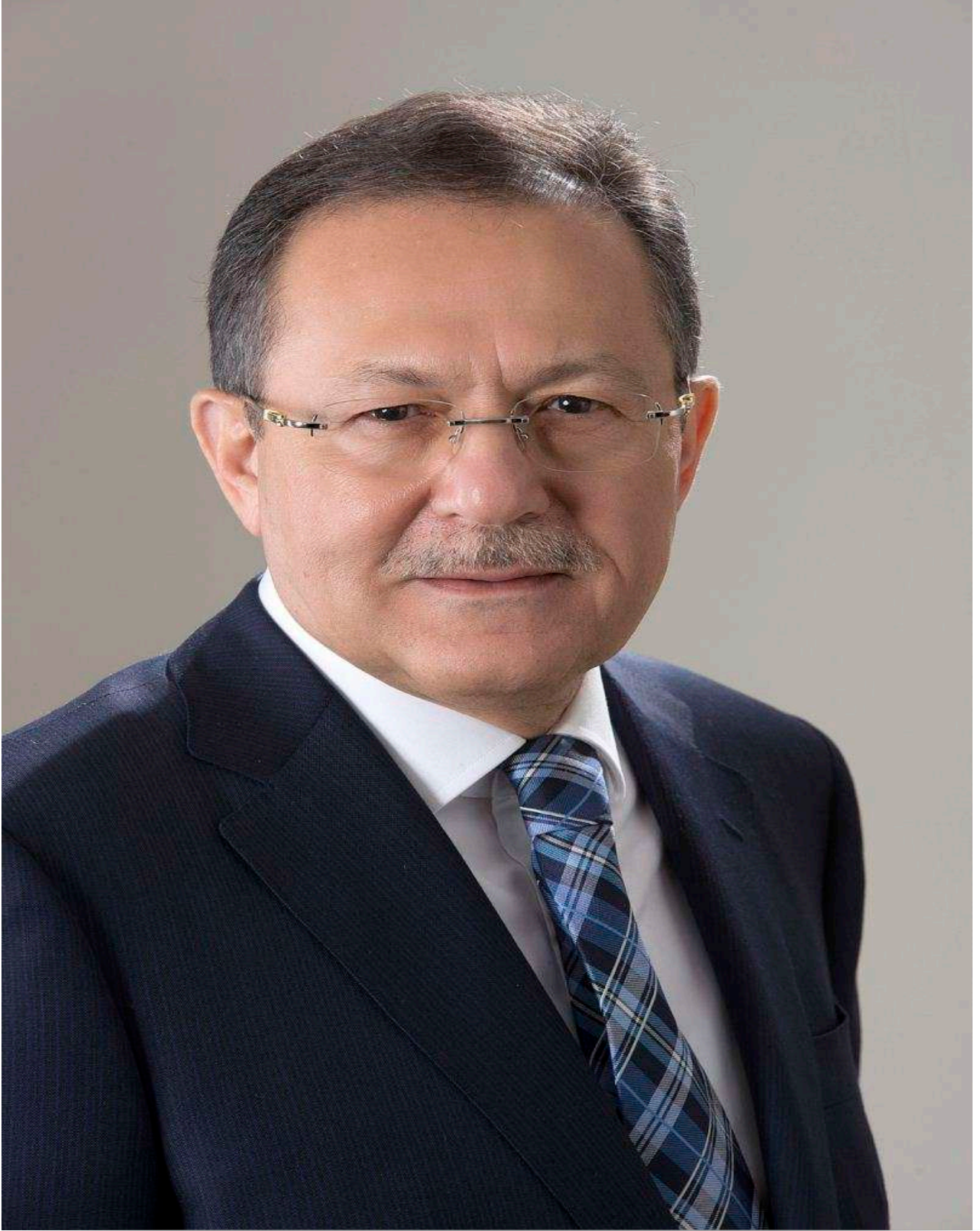
Ahmet Edip UĞUR | Balıkesir Büyükşehir Belediye Başkanı