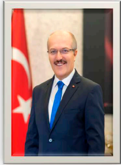
Zekai KAFAOĞLU Altıeylül Belediye Başkanı

İç kontrol standartlarına uyum sağlamak üzere hazırlanan Altıeylül Belediye Başkanlığı Kamu İç Kontrol Standartlarına Uyum Eylem Planının hazırlanmasına katkı sağlayan tüm personelimize teşekkür ediyorum.