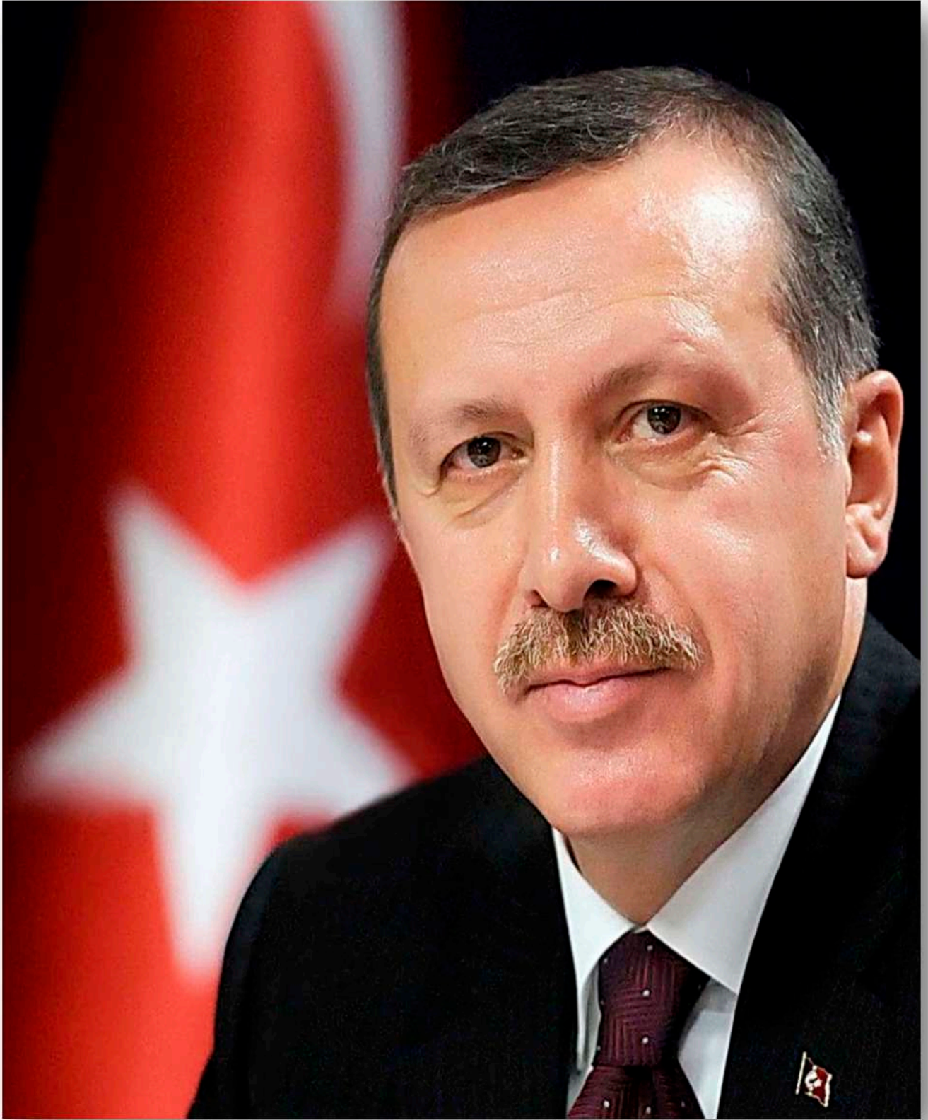
Recep Tayyip ERDOĞAN | Cumhurbaşkanı