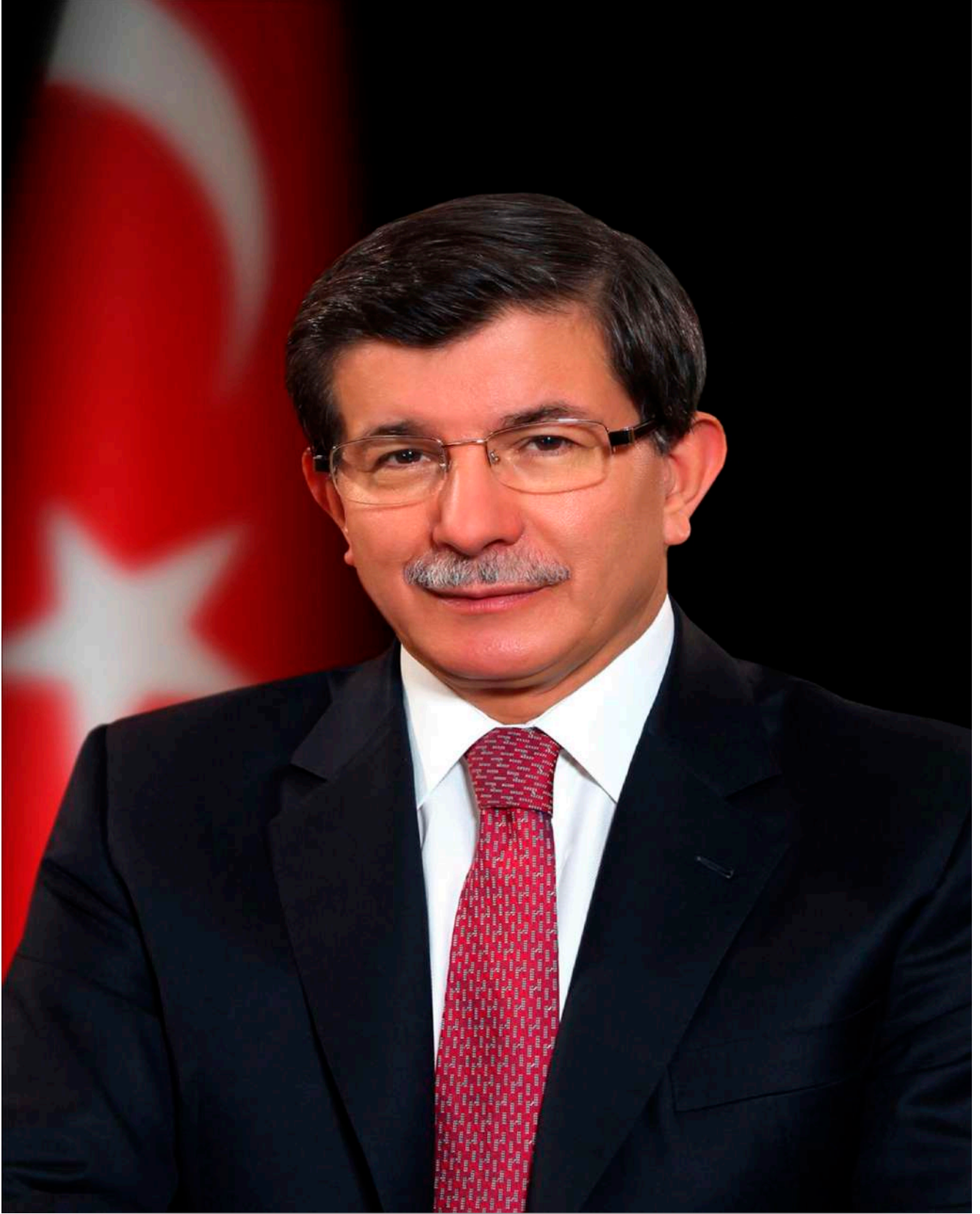
Ahmet DAVUTOĞLU | Başbakan