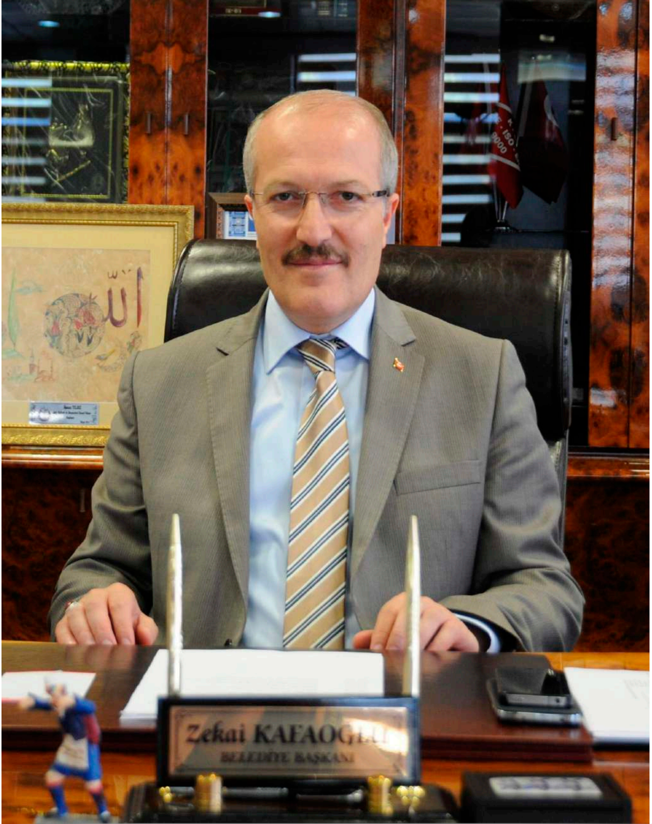
Zekai KAFAOĞLU | Altıeylül Belediye Başkanı