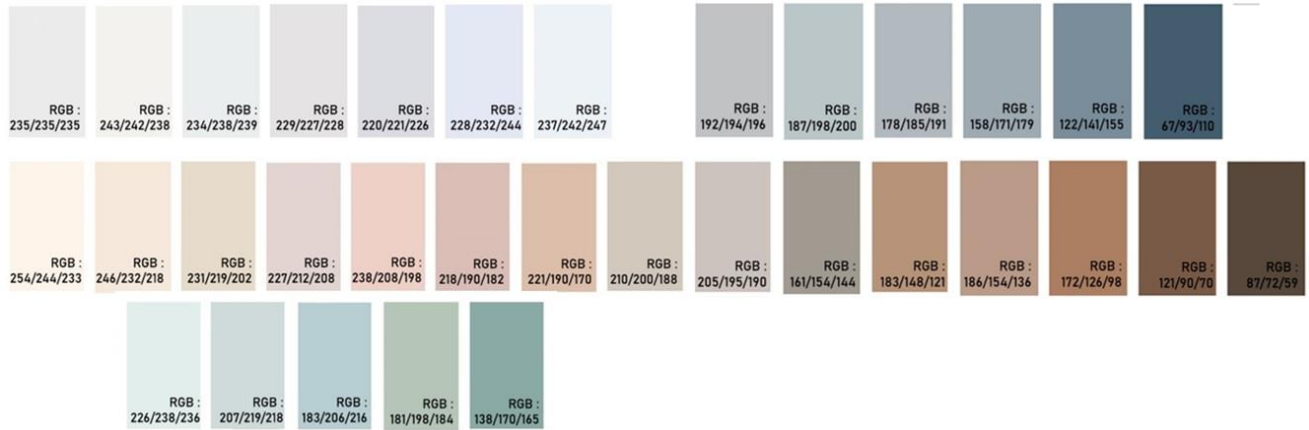
Şekil 3. Ticaret Alanlarındaki Yapılaşmalarda Uygulanacak Renk Kartelası